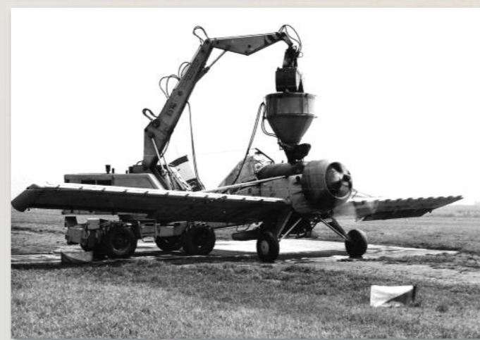
Links wird eine Kruk für den Streueinsatz beladen. – Oben eine Kruk und eine Dromader .

Agrarflug in Deutschland ist zwar eine Randnotiz des Flugwesens geworden, aber er existiert. So gibt es ein mehr oder weni-