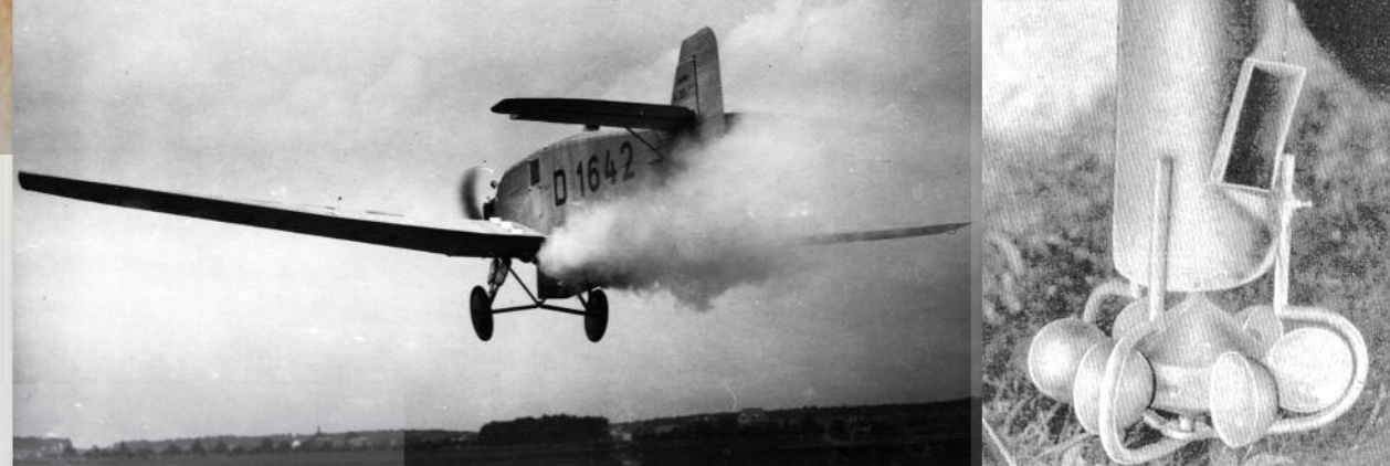
Junkers W33 D-1642 im Streueinsatz; rechts der Giftstoffverteiler an Junkers F13.

Merck-Produkten. Später füllen die neuen Mehrzweckflugzeuge W33 (D-1125, D-1166, D-1642 und der Prototyp D-921) die kleine Luftflotte auf.