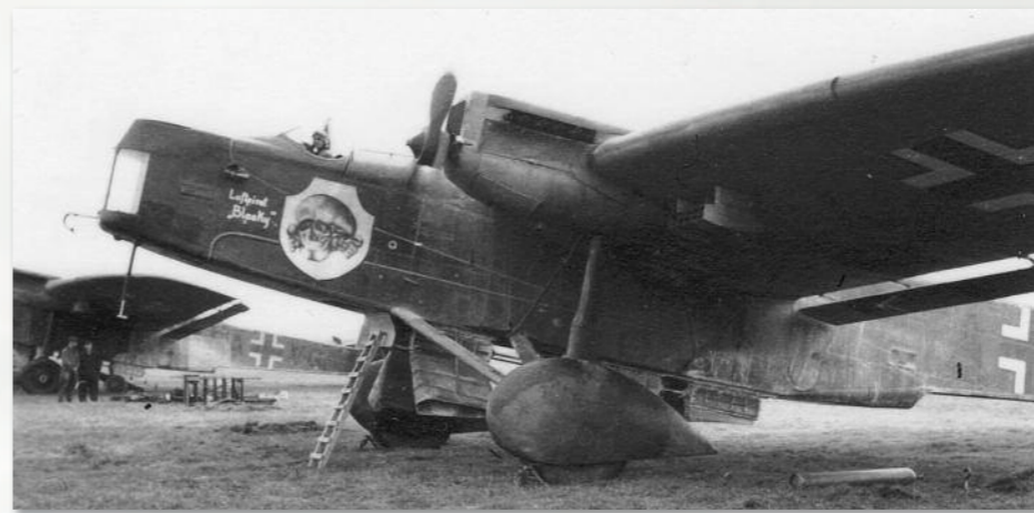
Hier eine Dornier Do 23G als Sprühflugzeug.

Seine größte wirtschaftliche Bedeutung erlangte der deutsche Agrarflug in der ehemaligen DDR. Als 1955 die Deutsche Luft Hansa der DDR (DLH) gegründet wurde, entstand hier auch die Abteilung Wirtschaftsflyer für die sich entwickelnde industrialisierte Land- und Forstwirtschaft. Hintergrund war die angestrebte Eigenversorgung