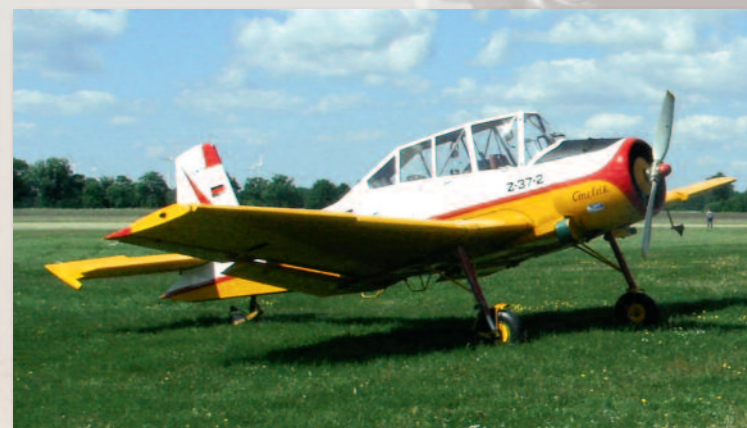
Die Z-37 Cmelak (hier eine Schulungsmaschine) war lange Zeit das Standard-Agrarflugzeug der DDR.