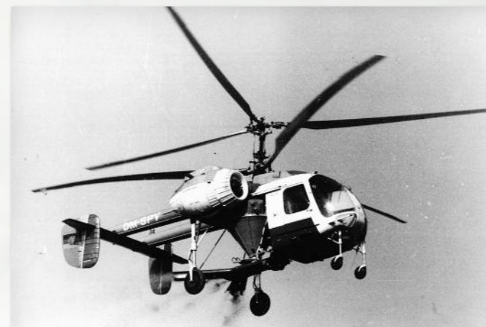
Neben den genannten Flugzeugen kamen vor allem in Mittelgebirgslagen Mehrzweckhubschrauber des Typs Kamow Ka-26 mit Koaxial-Rotoren zum Einsatz.

ger verbreitetes Angebot an Agrarflugdiensten, so auch am Stützpunkt der FSB Air Services GmbH in Kyritz, wo wieder vier M-18A stationiert sind. Die Firma ist international tätig und hat in Deutschland sogar Böschungen an neuen Autobahnen mit Rasensaaten im Streuverfahren aus der Luft begrünt. FSB sucht übrigens dringend neue Piloten, da die etablierten in Rente gehen. Mit Hughes- und Bell- Hubschraubern erbringen Firmen wie DHD Heliservice GmbH im havelländischen Groß Kreuzt und die Helilift GmbH & Co. KG in Ahlen ihre Leistungen, um nur einige Firmen zu nennen.