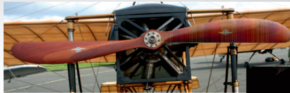
◀ Vom Original zum Modell: Die Plattform des manntragenden Flugzeugs wird per Software abgegriffen ...

M.S.: Hier muss man ganz klar sagen: nein. Ich habe wiederholt die Erfahrung gemacht, dass Modellbauer die Begriffe Wirkungsgrad, Standschub und Leistung in einen Topf werfen. Das ist ein Irrweg. Um Aussagen zum Wirkungsgrad einer Luftschraube zu machen, fehlt bei der Standschubmessung eine entscheidende