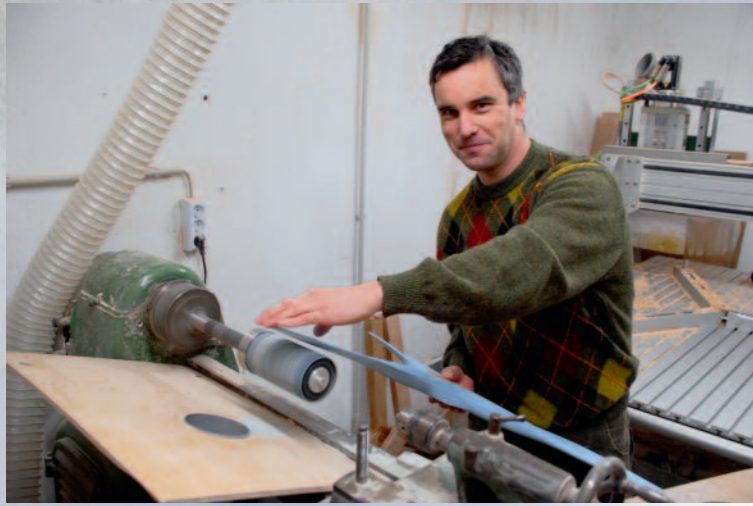
◀ Der Feinschliff erfolgt in Handarbeit. Eine Signalfarbe erleichtert den gleichmäßigen Abtrag.

lings, der Arbeitsbereich der Fräse, Einspannmöglichkeiten usw. berücksichtigt werden. Anschließend wird die fertige 3D-Zeichnung in ein CAM-Programm importiert, in dem mit Hilfe verschiedener Strategien die Fräsbahnen erzeugt und abgespeichert werden, um sie der Fräsensteuerung zu übermitteln.