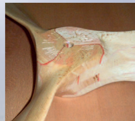
Die besondere Formgestaltung sorgt für ein optimales Ineinandergreifen der einzelnen Lamellen. ▼